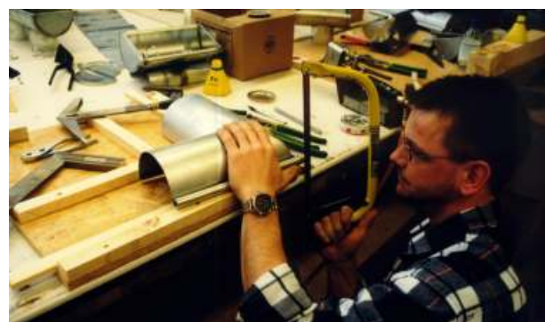
Auch Blecharbeiten gehören selbstverständlich dazu.