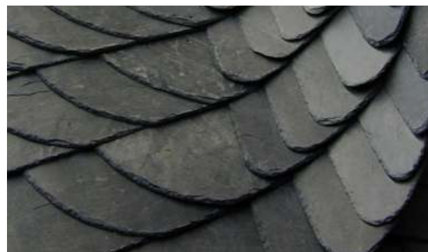
Neben Ziegeldeckungen haben Schieferdeckungen einen großen Anteil am praktischen Unterricht.

im BUNDESBILDUNGSZENTRUM des Zimmerer- und Ausbaugewerbes gGmbH